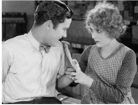
1927 LA PETITE VENDEUSE (My Best Girl) de Sam Taylor avec Mary Pickford