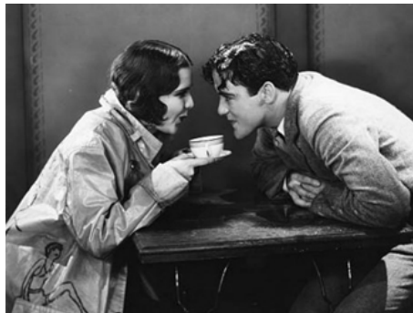
1928 TEL PÈRE, TEL FILS (Varsity) de Frank Tuttle avec Mary Brian