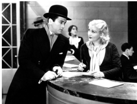
1931 WORKING GIRLS de Dorothy Arzner avec Judith Wood