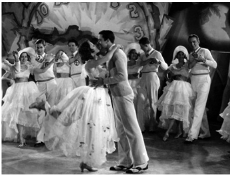
1930 PARAMOUNT IN PARADE , Love Time de Victor Schertzinger avec Lillian Roth