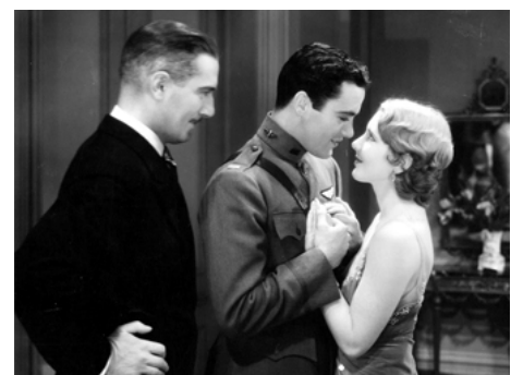
1930 LES JEUNES AIGLES (Young Eagles) de William A. Wellman avec Paul Lukas, Jean Arthur