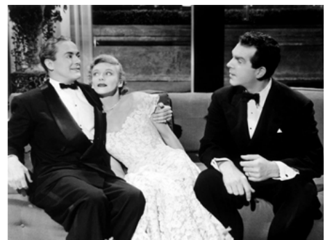
1948 TOUS LES MARI S MENTENT ( An Innocent Affair ) de L. Bacon avec Madeleine Carroll, Fred MacMurray