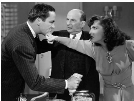
1941 MEXICAN SPITFIRE'S BABY de Leslie Goodwins avec Leon Errol, Lupe Velez