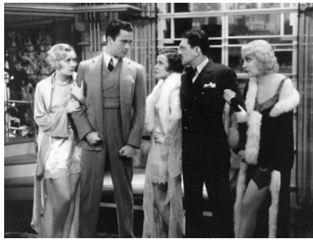
1930 SAFETY IN NUMBERS de Victor Schertzinger avec K. Crawford, J. Dunn, F. McDonald, C. Lombard