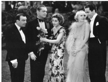
1933 TAKE A CHANCE de Monte Brice & L. Schwab avec J. Dunn, C. Edwards, Lillian Roth, June Knight