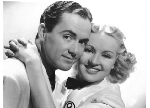
1937 THIS WAY PLEASE de Robert Florey avec Betty Grable