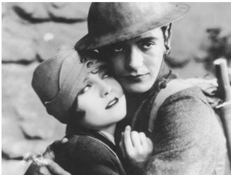
1928 MON RABBIN CHEZ MON CURÉ (Abie's Irish Rose) de Victor Fleming avec Nancy Carroll