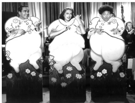
1941 SING FOR YOUR SUPPER de Charles Barton avec Jinx Falkenburg, Bert Gordon