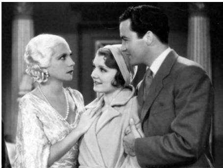
1931 LE CHEMIN DU DIVORCE ( The Road to Reno ) de Richard Wallace avec P. Shannon, Lilyan Tashman