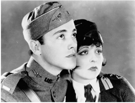
1927 LES AILES (Wings) de William A. Wellman avec Clara Bow