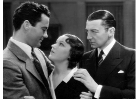
1931 THE LAWYER'S SECRET de Louis Gasnier avec Fay Wray, Clive Brook