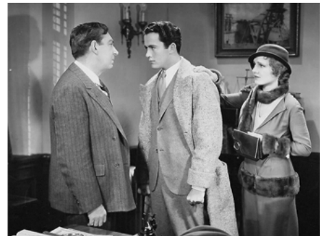
1932 L'ÂGE INGRAT ( This Reckless Age ) de Frank Tuttle avec David Landau, Peggy Shannon