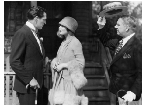
1926 AÏE, MES AÏEUX ! (So's Your Old Man) de Gregory La Cava avec Alice Joyce, W. C. Fields