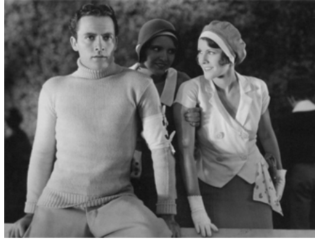
1930 ALONG CAME YOUTH de Lloyd Corrigan & Norman Z. McLeod avec Frances Dee