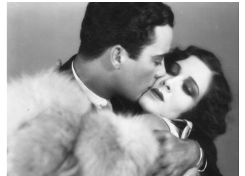
1928 SOMEONE TO LOVE de F. Richard Jones avec Mary Brian