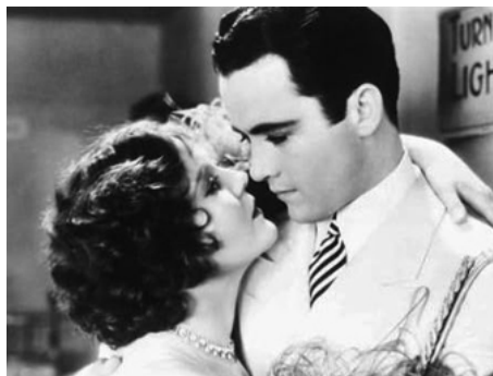
1929 HARMONIE (Close Harmony) de John Cromwell & A. Edward Sutherland avec Nancy Carroll