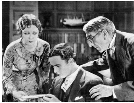
1926 MORE PAY, LESS WORK d'Albert Ray avec Mary Brian, Otto Hoffman