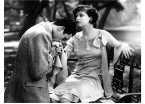
1927 IL FAUT QUE TU M'ÉPOUSES (Get Your Man) de Dorothy Arzner avec Clara Bow